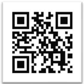
星まつりページ のQRコード

L I N E : 金剛寺LINE公式 (@kongoji) を友達登録し、申込書のデータを添付してメッセージを送信してください